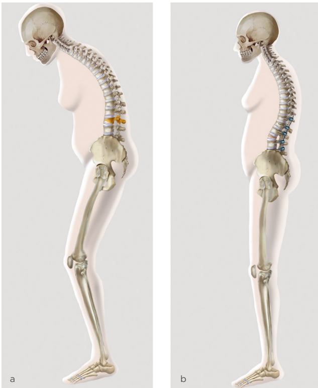
Abb. 1 Die Kyphose ist eine Verkrümmung der Wirbelsäule nach vorne. Um die Balance zu halten, müssen die Betroffenen die Beine beugen (a). Nach der operativen Korrektur können die Patienten wieder aufrecht stehen und auch längere Strecken gehen (b).

Mit der Verkrümmung der Wirbelsäule einher geht häufig eine Verengung des Spinalkanals, wodurch es zu einer Kompression der durch ihn verlaufenden Nerven kommt. Die Patienten beschreiben in solchen Fällen eine Schmerzausstrahlung in die Beine und eine Unsicherheit beim Gehen. Selbst kurze Strecken können sie nur mit grosser Mühe zurücklegen. Trotz Hilfsmitteln wie Gehstöcken oder einem Rollator droht ihnen der Verlust der Selbstständigkeit.