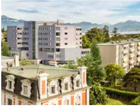
Hirslanden, cliniques Bois-Cerf et Cecil, hébergent toutes deux le Centre de la prostate Lausanne.