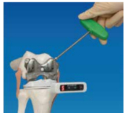
eLibra System – elektronisch gemessenes Ausbalancieren der Femurrotation mit Druckmessplatte

Weltweit werden jährlich ungefähr 1 Million Knieprothesen implantiert, in der Schweiz liegen die Zahlen bei circa 10 000 pro Jahr. Langzeituntersuchungen zeigen, dass ein korrekt eingesetztes und gut eingeheltes Kniegelenk problemlos mehr als 20 Jahre funktionieren kann. Die Statistiken bestätigen, dass in über 90 Prozent der Fälle die Patienten mit dem künstlichen Kniegelenk sehr zufrieden sind und ein normales Alltagsleben führen können.