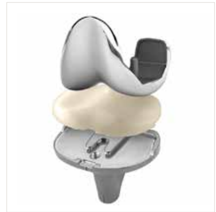
Modernstes Kunstgelenk am Knie Typ Persona Zimmer