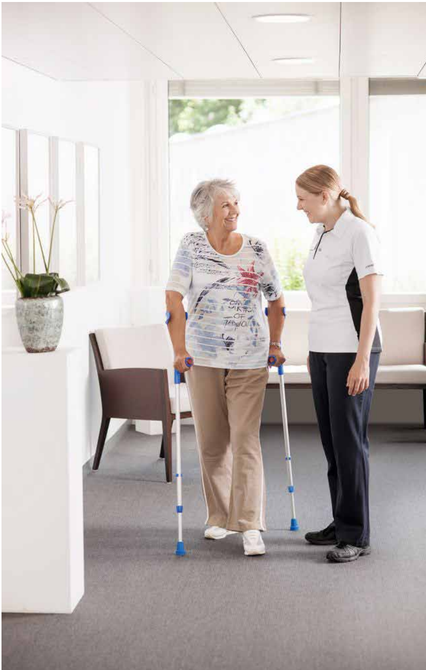
Über 90 % der Patienten mit einem künstlichen Kniegelenk sind sehr zufrieden und führen wieder ein normales Alltagsleben.