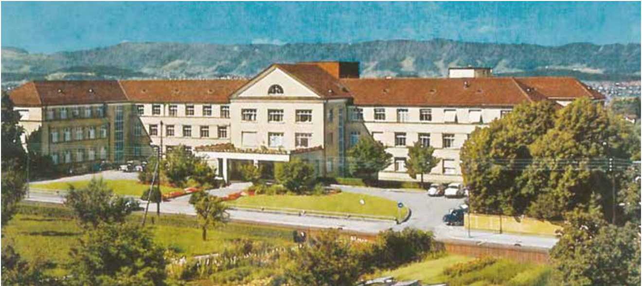
Stammhaus und Namensgeberin der Privatklinikgruppe Hirslanden: die 1932 eröffnete Klinik Hirslanden.

folio betrachtete. Nun schien der Zeitpunkt günstig, die Klinikgruppe zu verkaufen. So ging die Gruppe 2002 an die britische Beteiligungsgesellschaft BC Partner Funds. Es folgten fünf intensive Jahre, in denen sämtliche verfügbaren Mittel in die Weiterentwicklung der Kliniken und der Gruppe sowie in die Übernahme der traditionsreichen Klinik St. Anna in Luzern investiert wurden. 2007 verkaufte BC Partner Funds Hirslanden schliesslich an Mediclinic International. Die südafrikanische Spitalgruppe war der Wunschpartner von Hirslanden, da sie als langfristig orientierter Investor aus der eigenen Branche neue Entwicklungsperspektiven eröffnen konnte.