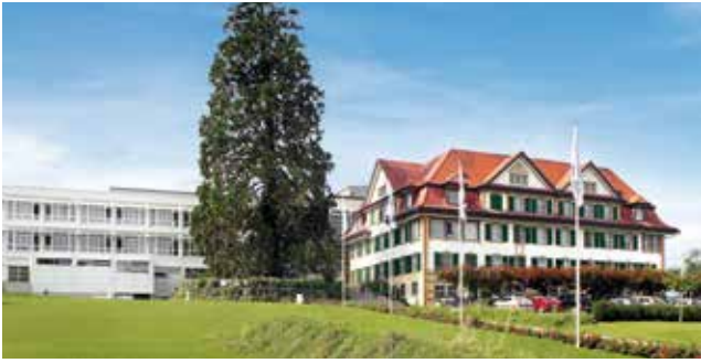
ANDREASKLINIK CHAM ZUG