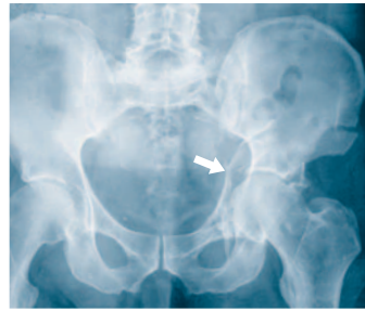
Abb. 3 Das Röntgenbild des Beckens zeigt die Acetabulumfraktur eines 56-jährigen Patienten nach Sturz auf dem Eis mit deutlicher Verschiebung des Oberschenkelkopfes nach innen.

Bei den ersten 20 Patienten mit einem Altersdurchschnitt von 59 Jahren – der älteste war 90-jährig – zeigten sich während und nach der Operation keine wesentlichen Komplikationen (Abb. 3). Die Operation dauerte durchschnittlich drei Stunden. In der postoperativen Computertomographie wurde bei 19 Patienten eine anatomische Reposition mit weniger als 1 mm Verschiebung und nur bei einem Patienten eine solche von 2 mm festgestellt. Nach zwei Jahren konnten 17 Patienten nachuntersucht werden. Zwei Patienten erhielten 4 respektive 18 Monate nach der Operation eine Hüfttotalprothese, alle anderen Patienten (88%) hatten eine exzellente oder gute Funktion (Abb. 4). Der «Pararectus»-Zugang ist nicht nur ein minimalinvasiver Zugang, sondern scheint die Versorgung von Acetabulumfrakturen auch bei älteren Patienten zu verbessern. Er sollte jedoch nur von einem erfahrenen Beckenspezialisten angewandt werden, damit bei dieser anspruchsvollen und hochspezialisierten Chirurgie Komplikationen vermieden und gute Ergebnisse erreicht werden.