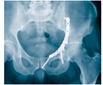
Abb. 4 Zwei Jahre nach der Versorgung über den «Pararectus»-Zugang zeigt das Röntgenbild des Beckens eine vollständige Heilung der anatomisch gerichteten Acetabulumfraktur ohne Zeichen einer Hüftgelenksarthrose. Der Patient ist beschwerdefrei.