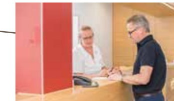
Am Empfang werden die Personalien aufgenommen