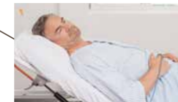
Patient wird stationär in die Hirslanden Klinik Aarau aufgenommen