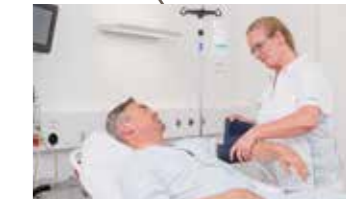
Erstversorgung durch das Notfall-Pflegefachpersonal