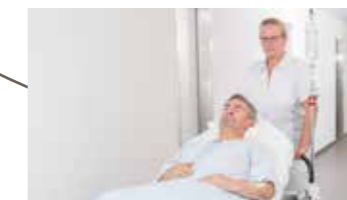
Spezielle Untersuchungen (z.B. CT, MRI)