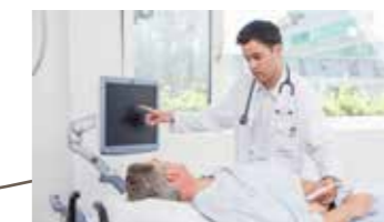
Bei Bedarf weitere Untersuchungen durch die Fachärzte