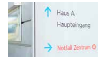
Patient betritt das Notfall Zentrum