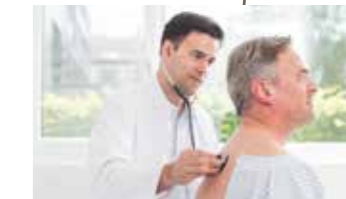
Untersuchung durch den diensthabenden Notfallarzt