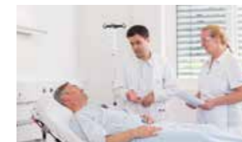
Diagnose- und Behandlungsbesprechung mit dem Patienten (Prozedere/Entscheidung)