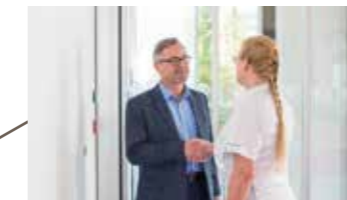
Patient wird ambulant behandelt und nach Hause entlassen oder