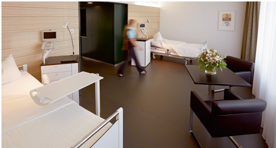
Ein Zweibettzimmer im Enzenbühltrakt (exemplarisches Bild).