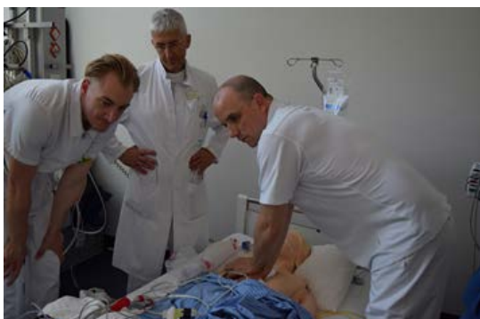
Die modernen Simulatoren ermöglichen eine genaue Evaluation der Reanimationsmassnahmen.

Bilder (für hohe Auflösung bitte Email an konradin.krieger@hirslanden.ch )