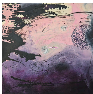
«Ein Flügelschlag», Acryl auf Leinwand