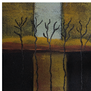
Burga Etter Allee; Bitume et acrylique sur car- ton, cadre en bois